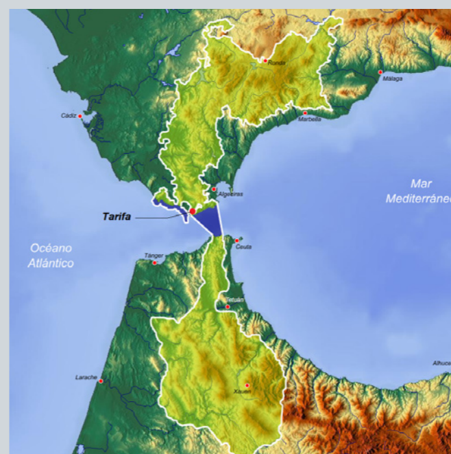
Réserve de biosphère intercontinentale de la Méditerranée.