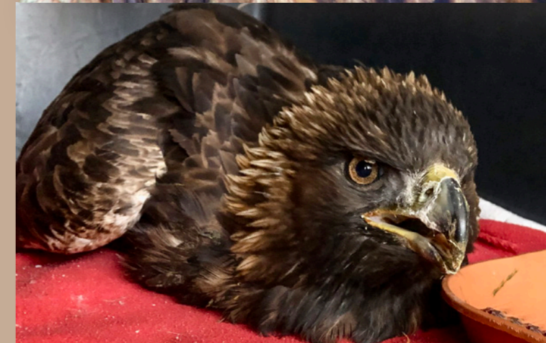
Aigle atteint de saturnisme reçu cet hiver.

d'une intoxication au plomb. Des soins et traitements spécifiques ont été mis en place par l'équipe pour neutraliser cet élément toxique afin qu'il puisse être éliminé de son organisme. Mais malheureusement, les dégâts causés aux organes internes étaient trop graves et malgré tous nos efforts, l'Aigle est décédé une semaine après son arrivée.