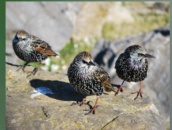
Etourneau sansonnet

La séance est suivie d'une présentation de Bernard Genton intitulée « Torcol fourmilier à la Côte - des facéties comportementales à la recolonisation ». Lors de cette conférence, nous avons découvert les comportements originaux et hauts en couleurs du Torcol ainsi que la dynamique de la population de la Côte vaudoise, des années 50 à nos jours.