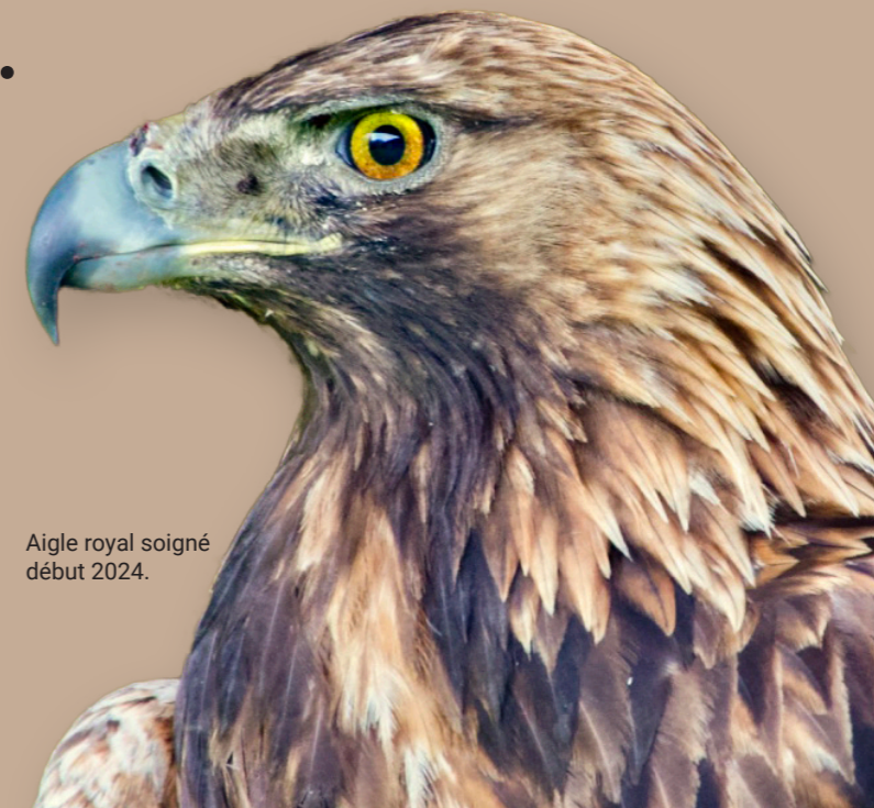
Aigle royal soigné début 2024.

En collaboration avec Nouvel Envol (la station de soins des Marécottes), cet oiseau a été rapatrié à la Vaux-Lierre dans un état grave. Son examen clinique a permis d'établir qu'il était aveugle, qu'il avait une paralysie des pattes et qu'il souffrait de troubles digestifs. Une prise de sang a permis de déterminer qu'il s'agissait