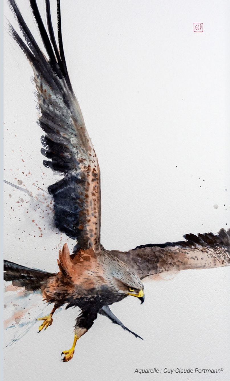
Aquarelle : Guy-Claude Portmann®

Nous ne pouvions rêver de recevoir des nouvelles plus encourageantes puisque Tarifa est un lieu incontournable pour la migration post-nuptiale des oiseaux qui rejoignent leurs quartiers d'hiver. Tarifa est en effet le point le plus méridional d'Espagne, et également le plus proche de l'Afrique, à moins de 15 km du Maroc. En automne, mais également au printemps, plusieurs millions d'oiseaux franchissent la Méditerranée en ce point précis, qu'il s'agisse d'oiseaux de petite à moyenne taille comme les Hirondelles de fenêtres et les Huppés fasciées, mais également