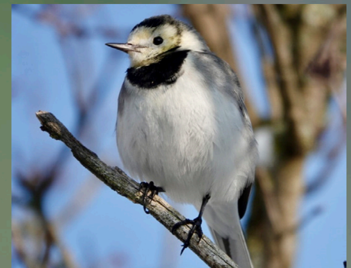
Bergeronnette grise