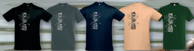
Noir Anthracite Bleu marine Beige Vert