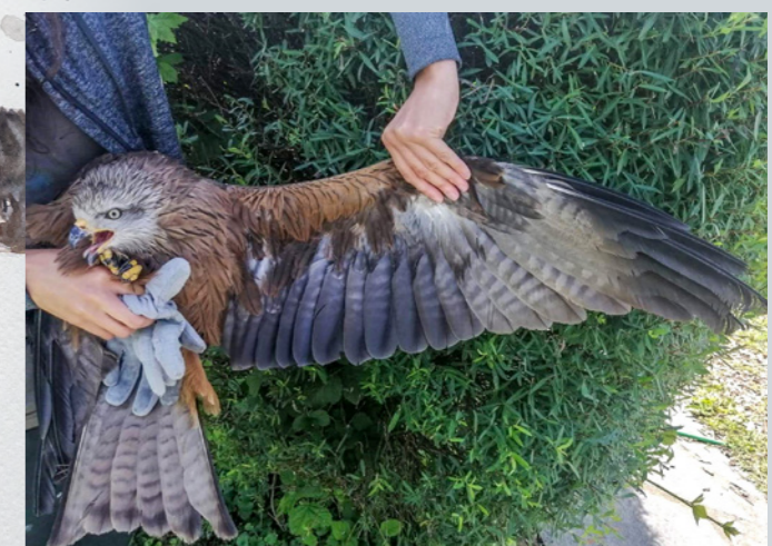
Le fameux Milan noir avant son lâcher en juin 2024

L'histoire de ce Milan noir nous touche particulièrement car les reprises de bagues ne sont pas fréquentes et lorsque nous soignons un oiseau sauvage, notre but est de pouvoir lui permettre de reprendre le cours de sa vie après un accident de parcours qui aurait pu lui être fatal. Ces petites nouvelles nous encouragent à continuer à soigner les oiseaux qui arrivent au centre de soins, même lorsque l'issue positive de la prise en charge n'est pas forcément évidente au premier regard !